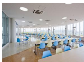
▲日替わりでメニューを選べる食堂