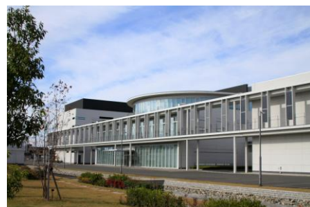
▲埼玉県にある草加工場

当社の開発・製造拠点は、埼玉県草加市にあります 転勤なし、夜勤なし、土日祝休み、年間休日は128日です