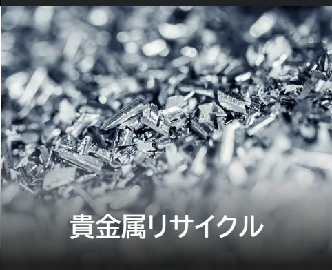
貴金属リサイクル