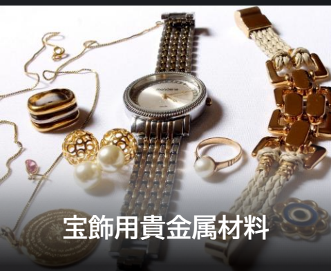
宝飾用貴金属材料