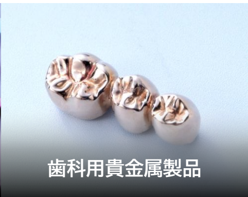
歯科用貴金属製品