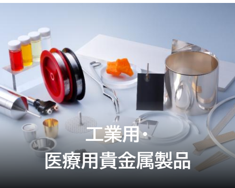
工業用・ 医療用貴金属製品