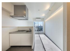
▲アパートタイプの独身寮