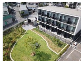
▲BBQもできる緑豊かな庭