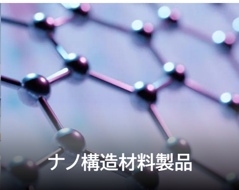
ナノ構造材料製品