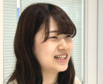
2021年入社 財務部 経理課

大学で得たマーケティングの知識や、お客様目線を大切にすることが役立っています。製品設置や修理の業務はユーザー様と直接関わるため、信頼関係構築や、お客様のニーズや期待を正確に理解することが不可欠です。お客様が喜ばれている様子をその場で見ることができるので、やりがいを感じます。慣れないことも多いですが「いつでも相談してね」と先輩たちが声をかけてくれるので、「まだまだ頑張ろう!」と励まされます。