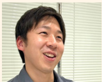
2023年入社 営業部 サービスエンジニアリング課