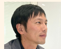
2007年入社 営業部 営業課

産休・育休を、それぞれ2回取得しました。「あなたの席は、しっかり残しておくからね」と快く送り出してもらい、安心して休暇を過ごせました。子どもが体調を崩しても「仕事はフォローするから、子供のお世話しっかりね!」と会社全体が子どもファーストに考えてくれています。子育て経験がある女性役員もいるので、何かあっても気兼ねなく相談でき、安心して仕事と育児を両立しています。