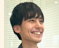
2018年入社 技術部 技術2課

協会社への支払、お客様からの入金処理、会計ソフトへの入力など、毎月の試算表完成に向けた業務が中心です。最近では、様々な補助金の申請手続きや「決算短信」の資料作りも担当しました。入社当時と比べ、発展的な業務が増えましたが、無理なくこなせたときに自分の成長を実感します。今後は、会社の数年後や将来に向けた資金管理を行う財務業務にも携わることを目標にしています。