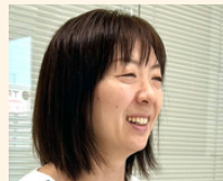
2004年入社 総務部 総務課

お客様にも社内の人に対しても、同じように寄り添って協力をすることを心がけています。誰かが困っていたら相手の立場を想像し、自分事として全力で応えることを大切にしている会社です。話したい、頼りたいと思えるような温かい人ばかりです。「しっかり応えてお役に立ちたい」という人を想う気持ちを皆から感じて嬉しいし、自分も同じように誰かの役に立とうと、仕事のモチベーションにも繋がっています。