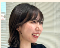
2018年入社 総務部 業務課

機械工学や力学の学びを活かし、CADを用いた塗装ブースの設計を中心に、様々な製品開発に携わっています。当社技術職は、一つの製品に設計から検証、設置まで全工程に携われるため、「これは自分が開発した」と胸を張れる仕事です。先輩たちに助けられながら経験を重ね、難題も前向きに捉えることができるようになりました。自分が開発した製品が商品化される瞬間に、大きなやりがいを感じます。