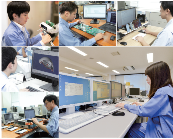
ハード・ファーム・ソフト、全ての技術を保有し顧客からのテクニカルな要望にも応え得ること。また様々な開発シーンにおいてエンジニア自身のアイデアや創意工夫を製品・システムに反映、やりがいと充実感に溢れた開発環境を整えています。

◆様々な技術セクション 技術系の職種としては、設計開発(※)、生産管理、調達、品質保証、調査研究、技術サービス、セールスエンジニア、システムエンジニア(クラウドサービス)の運用、技術サービス(本棟)、情報管理(社内専幹)システムの運用保守および設計開発などがあります。 ※①電気設計・回路設計・機構設計 ②ソフトウェア・スマホアプリ、クラウド ③組み込み(主に製品内部のハード制御)◆活躍の場 ◆電気電子、情報系の各分野で専攻されたれば、学んだ知識やスキル、実践経験を直接的に活かせる開発環境です。