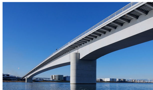
多摩川スカイブリッジ (令和3年度土木学会田中賞(作品部門)受賞)