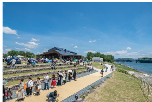
リバーポートパークミノカモ (2018年度グッドデザイン賞受賞)