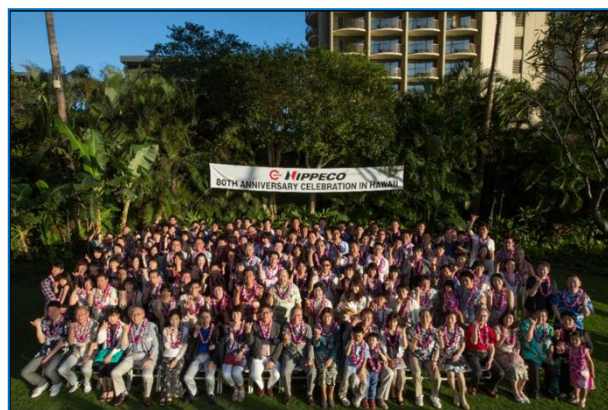
創業80周年記念ハワイ旅行

これは、社員が仕事とプライベートを両立していることにより、充実した毎日を過ごしている証拠です。個人的な趣味や勉強に一生懸命な人は、創造性も豊かになり、仕事においても成果を発揮すると考えています。