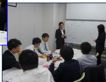
フォローアップ研修