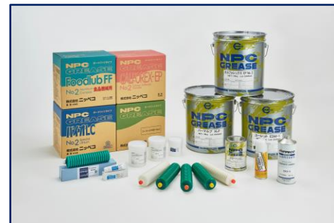
製品ラインナップ

また、私たちニッペコは、「会社は社員のためにある」と考えています。また、「社員が幸せになるための協働の場」とも考えています。その一つとして従業員持株制度があり、社員の多くが株主となり、自分の会社であると考え働いています。自分の会社に愛着が持て、楽しんで仕事出来る、社員のための会社を目指していきます。