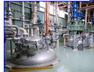
工場製造設備及び研究風景