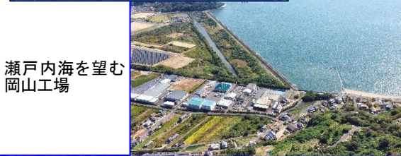
瀬戸内海を望む岡山工場